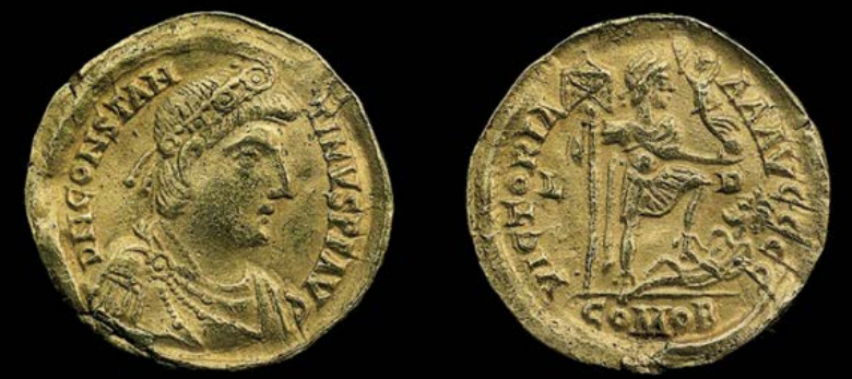
Goldmünze des Kaisers Constantinus III, 407 n. Chr. (Mackensen)