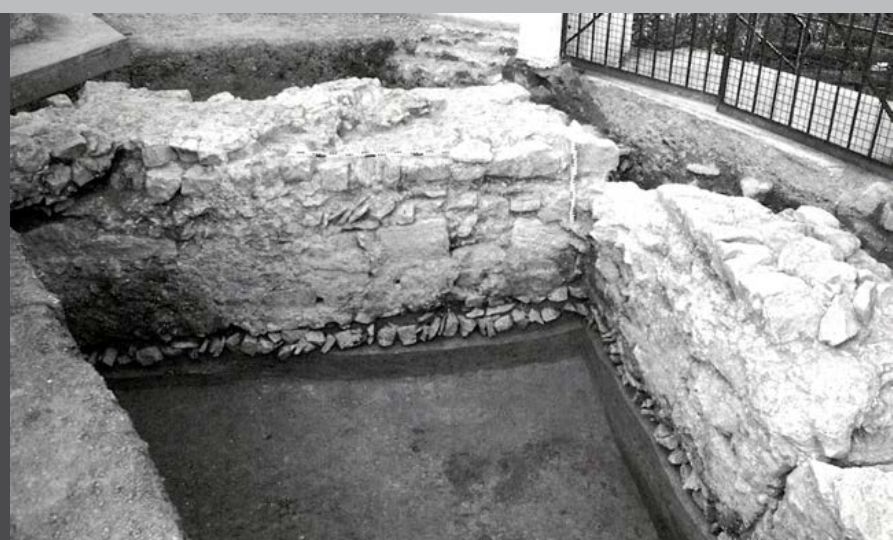
Innenansicht Ostecke des burgus (Grabungsfoto 1985, Mackensen)

A troop of about 12 to 24 soldiers would probably have manned the site. The watchtower seems to have been occupied at least into the 1st decade of the 5th century. Evidence for this are the two late Roman gold coins found near Finningen which might have been used to pay soldiers serving at the burgus.